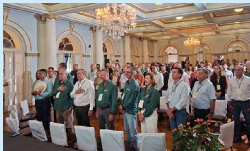
Convenção reuniu lideranças, cooperativas e autoridades

diálogo entre entidades e fortalecer o associativismo no agro. “Tenho certeza da importância de trazer palestras que dialogam com o momento que o Brasil vive, abordando temas como inovação e inteligência artificial”, acrescentou.