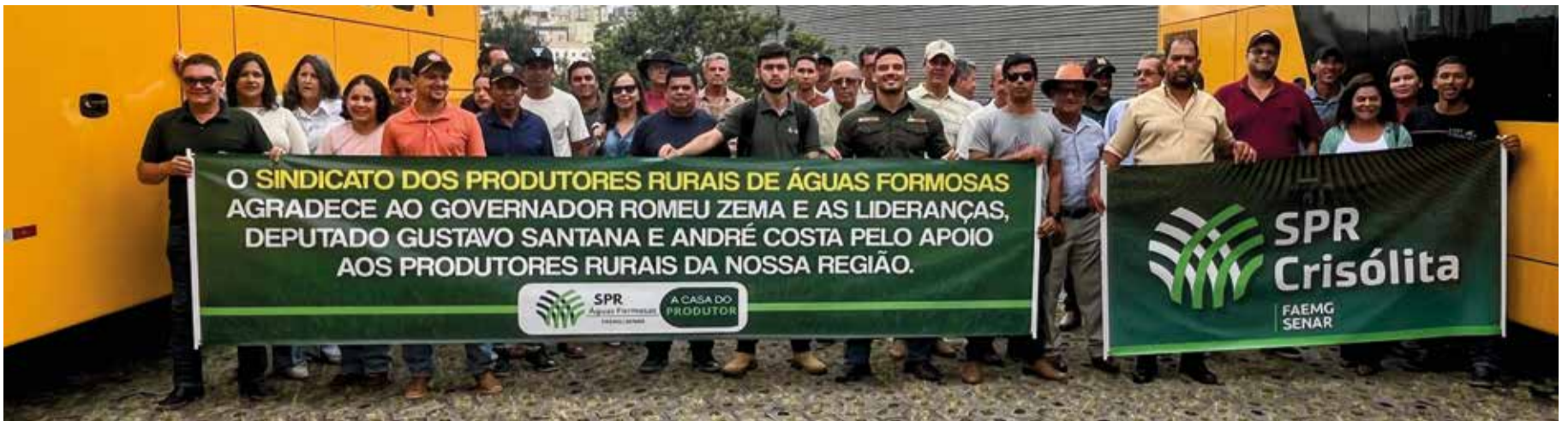
No Leste de Minas, a participação de cerca de 400 produtores rurais evidenciou a força regional no encontro, onde reconhecimento, integração e valorização do setor foram destaque

“É fundamental estarmos juntos e firmarmos nosso compromisso com o desenvolvimento do campo.”