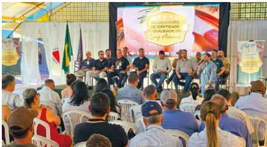
Lançamento do regulamento técnico: iniciativa foi conduzida pela Seapa, Emater-MG, Epamig, IMA e prefeitura

posta por sete municípios: Água Boa, Frei Lagonegro, José Raydan,