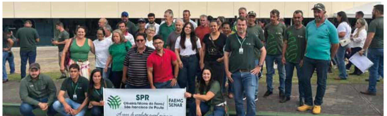
Cerca de 1.000 pessoas partiram de diferentes cidades do Sul e Sudoeste de Minas rumo ao evento histórico, mostrando o engajamento das regiões

A força do agro mineiro vem da união do setor e das pessoas que fazem o agro acontecer. Isso fica evidente na grande mobilização no interior do estado: caravanas de todas as regiões levaram milhares de pessoas até Belo Horizonte para exaltar o agro mineiro.