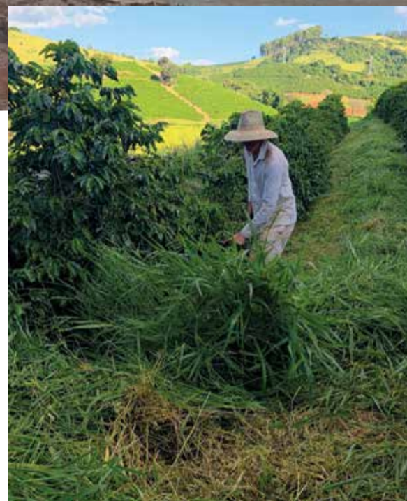
Produtor faz a roçada nas ruas do cafezal