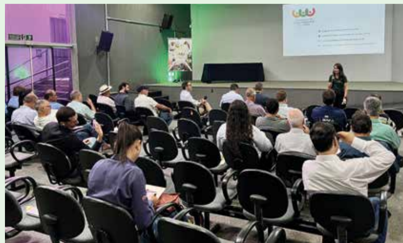
Reunião itinerante do Conselho de Representantes da Cemig em Uberaba

contou com a participação da diretoria da companhia, além de representantes dos setores industrial, comercial, poder público e consumidores residenciais.