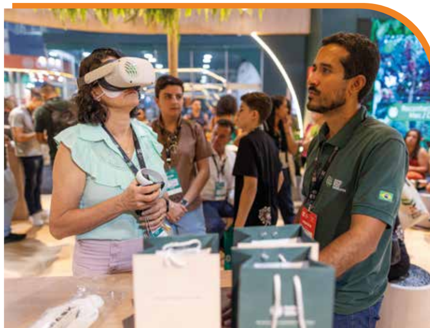
Óculos virtual possibilitou experiências imersivas e interativas em eventos

homens e mulheres do campo continuarão presentes no nosso diário de bordo, para que o trabalho do Senar Minas se traduza em transformação de vidas e melhoria da renda de produtores, trabalhadores rurais e seus familiares. Continuaremos fortes para que o Senar seja mais tecnológico, mais digital e mais virtual”, acrescentou.