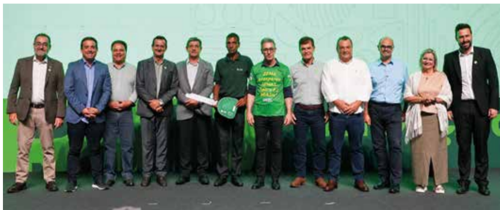
Participantes e lideranças parabenizam o produtor agraciado com o prêmio ATeG 2025