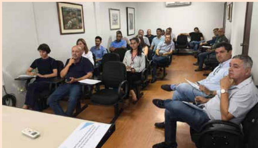
Reunião com IGAM e lideranças rurais abordou uso da água subterrânea