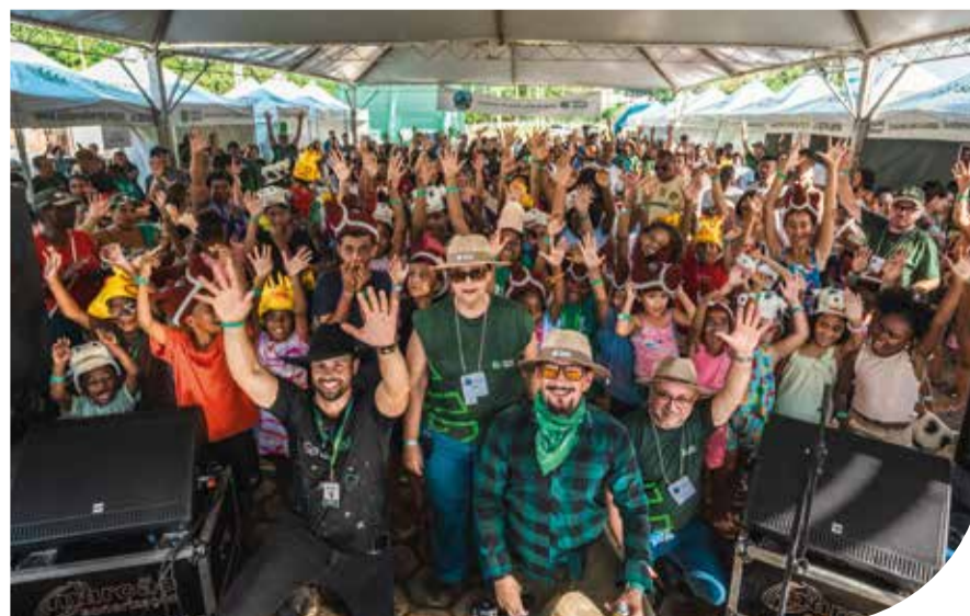
Programa Família do Campo promove ações de cidadania, saúde e bem-estar