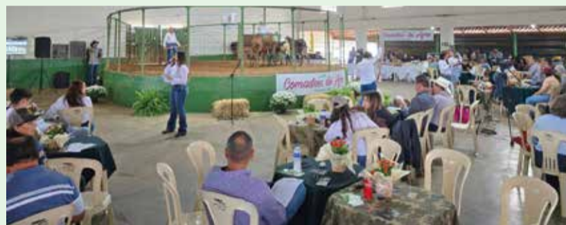
Leilão integrou ações do Mês da Mulher e reuniu 500 pessoas

O “Comadres do Agro”, grupo formado por produtoras rurais do Triângulo Mineiro, promoveu o 1º leilão de gado no dia 7 de março, em Nova Ponte. O evento reuniu cerca de 1.500 animais e registrou 93% de vendas, con-