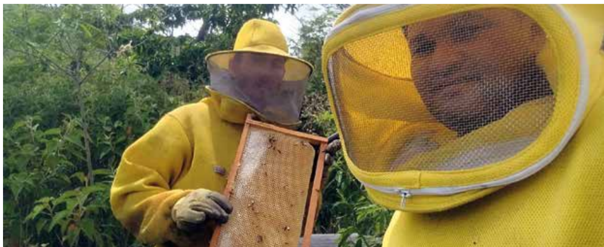
Cenário reflete a diversificação da produção rural, com geração de renda e práticas sustentáveis