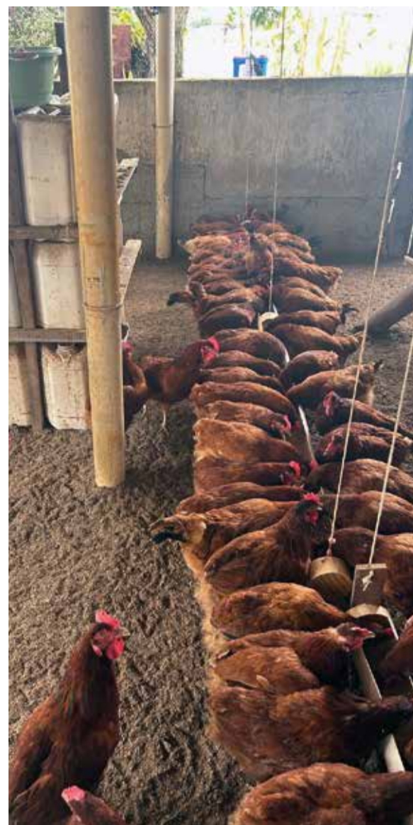
Minas Gerais ultrapassa Paraná no ranking nacional de produção de ovos