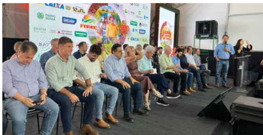
Edição 2026 da Femec contou com mais de 370 expositores