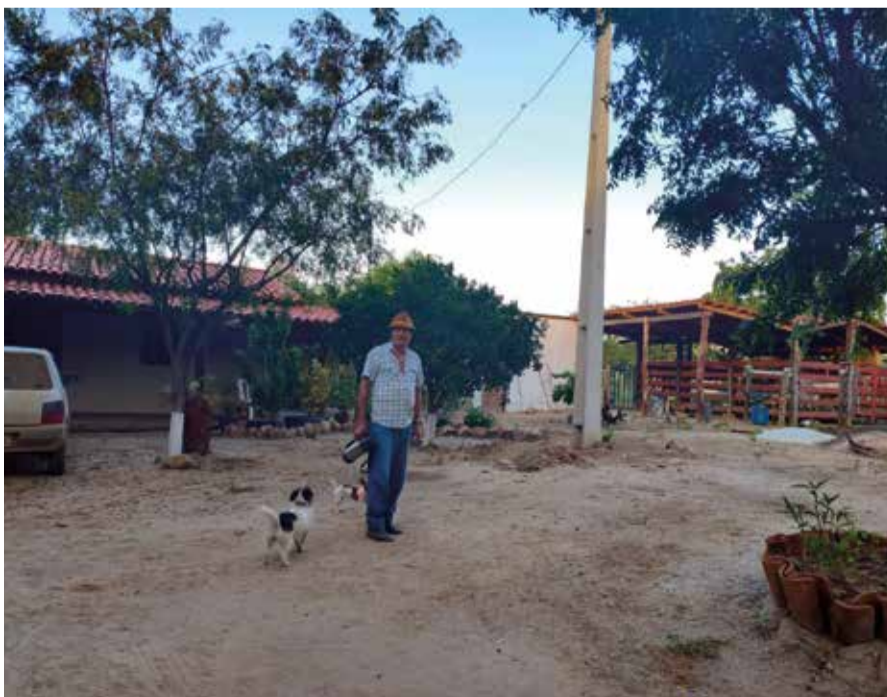
Energia elétrica permitirá ampliar eficiência produtiva

Conquista contou com o intermédio do Sistema Faemg Senar junto à Cemig