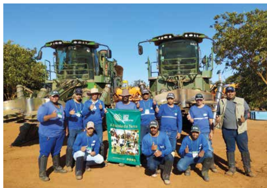
Expectativa para a safra 2026 é de aumento na produção de etanol

A tendência para a safra 2026 é de aumento na produção de eta-