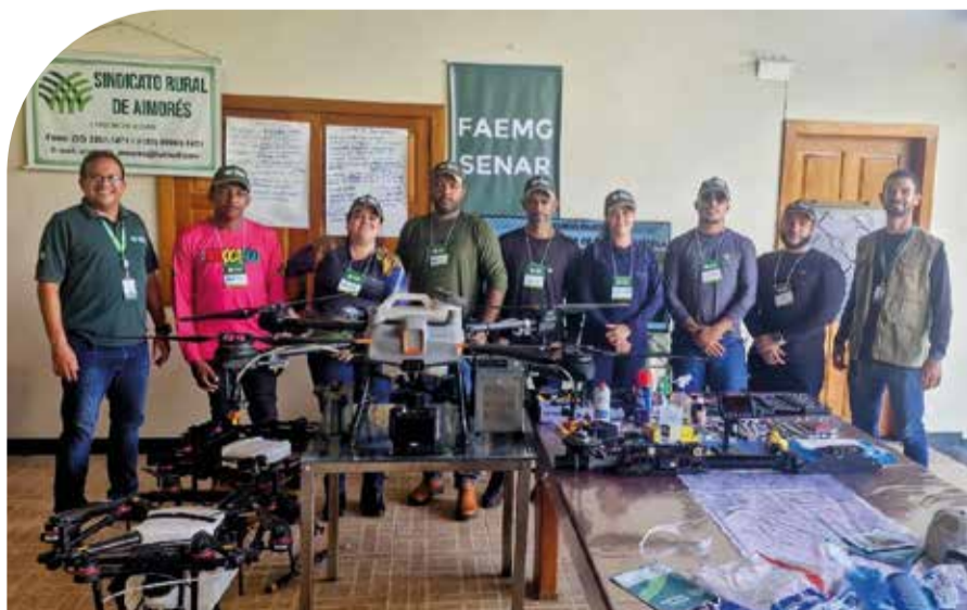
Senar Minas está atento às principais demandas do campo