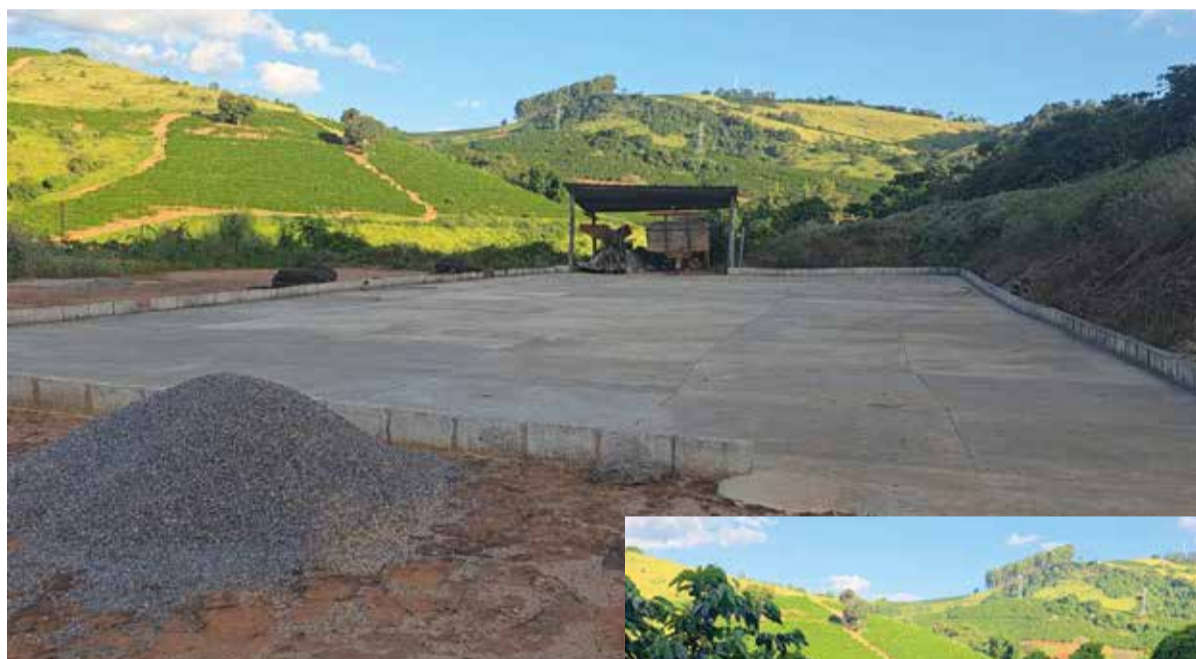
Café atingiu 84,5 pontos após melhorias no terreiro sugeridas pelo ATeG

Rotina que já começou no Sítio Ouro Verde, em Varginha.