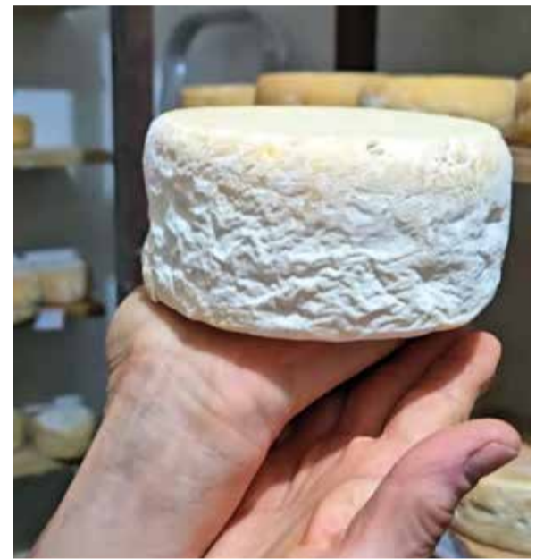
Rota conecta visitantes aos produtores da região Entre Serras da Piedade ao Caraça