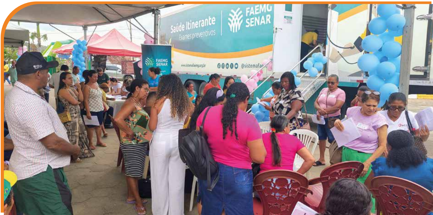
Com uma carreta equipada, o Saúde Itinerante percorreu 31 municípios em 2025