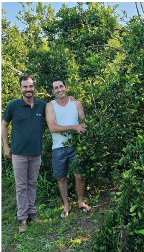
Acompanhamento do ATeG fez qualidade das frutas melhorarem