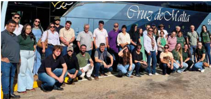
Sete caravanas do Triângulo Mineiro, com cerca de 350 pessoas de 27 municípios, pegaram a estrada para prestigiar o grande encontro de valorização do agronegócio

A participação da região central foi marcada pelo sentimento de pertencimento entre produtores e lideranças do campo. Cerca de 800 pessoas, organizadas pelos SPRs em 15 caravanas, marcaram presença.