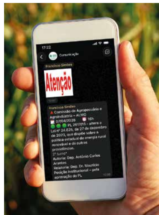
Superintendência de Relacionamento informa quais projetos de lei afetam o setor